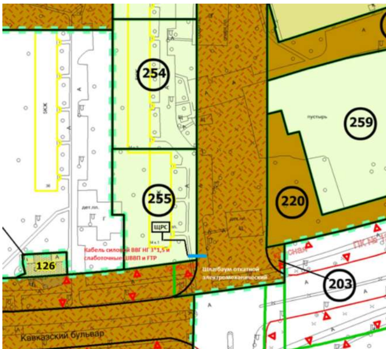
Рис. 1 Схема размещения шлагбаумов

Кавказский бульвар, дом 34, корпус 2, при въезде на дворовую территорию.