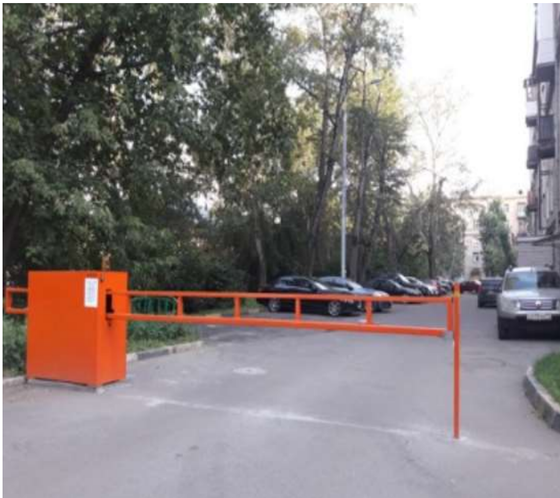
Рис. 2. Внешний вид шлагбаума.

окраска, стандартный цвет - оранжевый, оцинкованная зубчатая рейка (пр-во Италия) в комплекте.