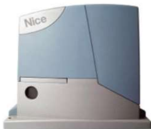
Рис. 3. Привод откатного шлагбаума.